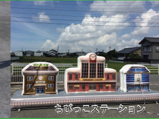
ちびっこステーション