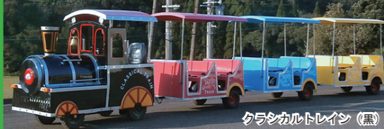
クラシカルトレイン (黒)