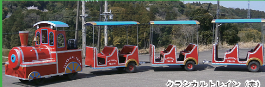
クラシカルトレイン (赤)