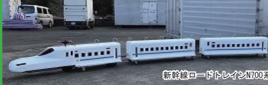
新幹線ロードトレインN700系

線路の設置が不要で自由なコースレイアウトが可能です。車両にまたがるタイプですが、足元にはステップがついていて安全に運行することができます。最大10名まで同時にご利用頂けます。つばめモデルはJR九州承認済み。