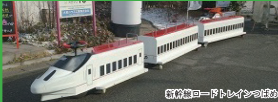
新幹線ロードトレインつばめ