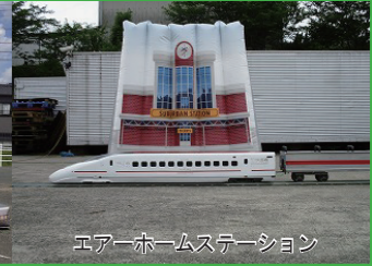
エアートンネル (カラフル)